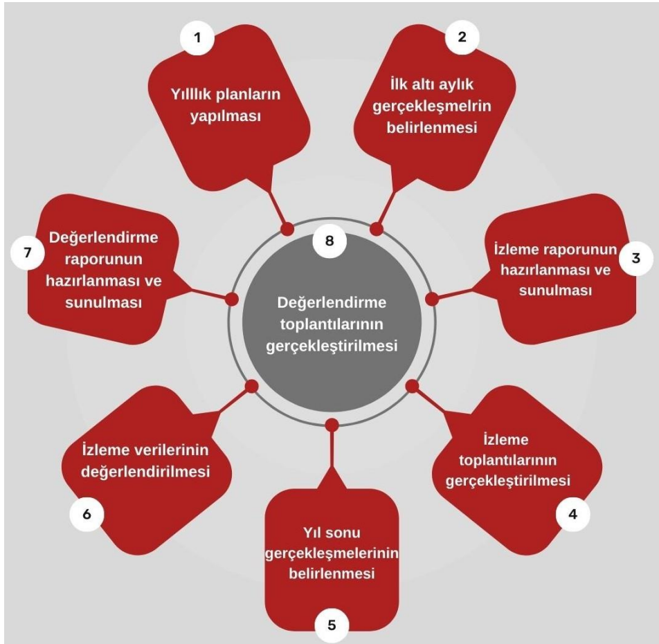
Şekil 4: İzleme ve Değerlendirme Süreci

İzleme ve değerlendirme sürecinin işleyişi ana hatları ile Şekil 4'te özetlenmiştir. Denizli-Çivril Keriman Kamer Anaokulu Müdürlüğü 2024–2028 Stratejik Planı'nda yer alan performans göstergelerinin gerçekleşme durumlarının tespiti yılda iki kez yapılacaktır. Ara izleme olarak nitelendirilebilecek yılın ilk altı aylık dönemini kapsayan birinci izleme kapsamında, MEM Stratejik Plan İzleme ve Değerlendirme Modülü vasıtasıyla, harcama birimlerinden sorumlu oldukları performans göstergeleri ve stratejiler ile ilgili gerçekleşme durumlarına ilişkin veriler toplanarak konsolide edilecektir. Performans hedeflerinin gerçekleşme durumları hakkında hazırlanan "Stratejik Plan İzleme Raporu" Müdür ve kurum içi paydaşların görüşüne sunulacaktır. Bu aşamada amaç, varsa öncelikle yıllık hedefler olmak üzere, hedeflere ulaşılmamasının önündeki engelleri ve riskleri belirlemek ve yıllık hedeflere ulaşılmasını sağlamak üzere gerekli görülebilecek tedbirlerin alınmasıdır. Yılın tamamına ilişkin ikinci izleme kapsamında ise MEM Stratejik Plan İzleme ve Değerlendirme Modülü vasıtasıyla, tarafından harcama birimlerinden sorumlu oldukları performans göstergeleri ve stratejiler ile ilgili yıl sonu gerçekleşme durumlarına ait veriler toplanarak konsolide edilecektir.